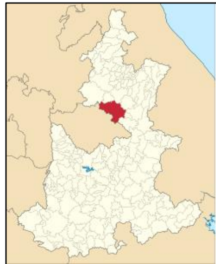
Figura 1. Mapa de Ixtacamaxtitlán.