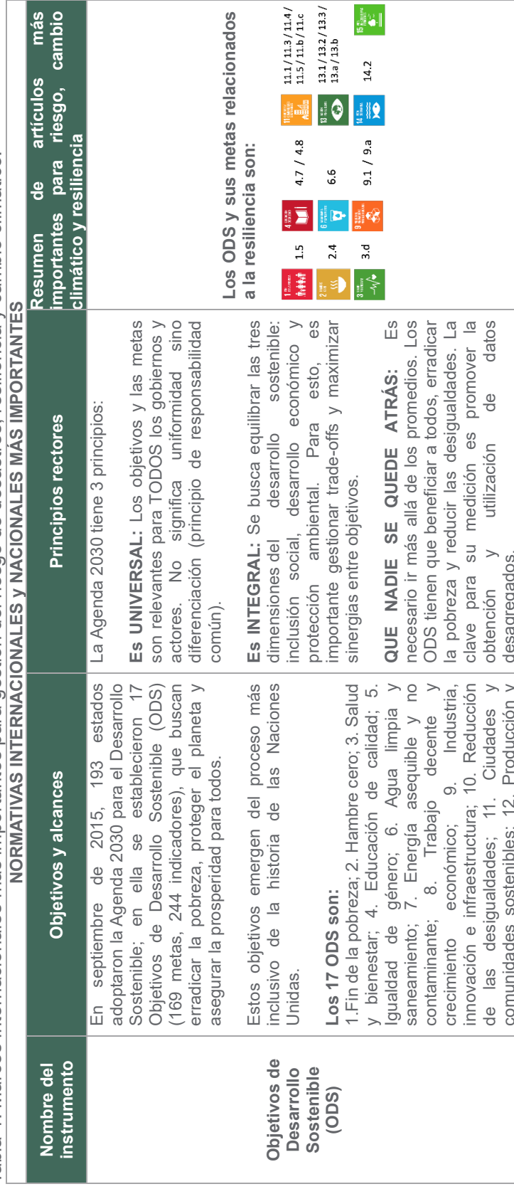
Tabla 1: Marcos internacionales más importantes para gestión del riesgo de desastres, resiliencia y cambio climático.

El marco legal que se presenta a continuación, resume los puntos más relevantes de los instrumentos internacionales más importantes para los temas de gestión del riesgo de desastres, resiliencia y cambio climático. Estos instrumentos establecen los estándares en la materia y han sido todos adoptados y ratificados por México; con lo cual, forman parte del marco legal mexicano. Además, se presenta el resumen de las principales leyes nacionales y generales de la temática.